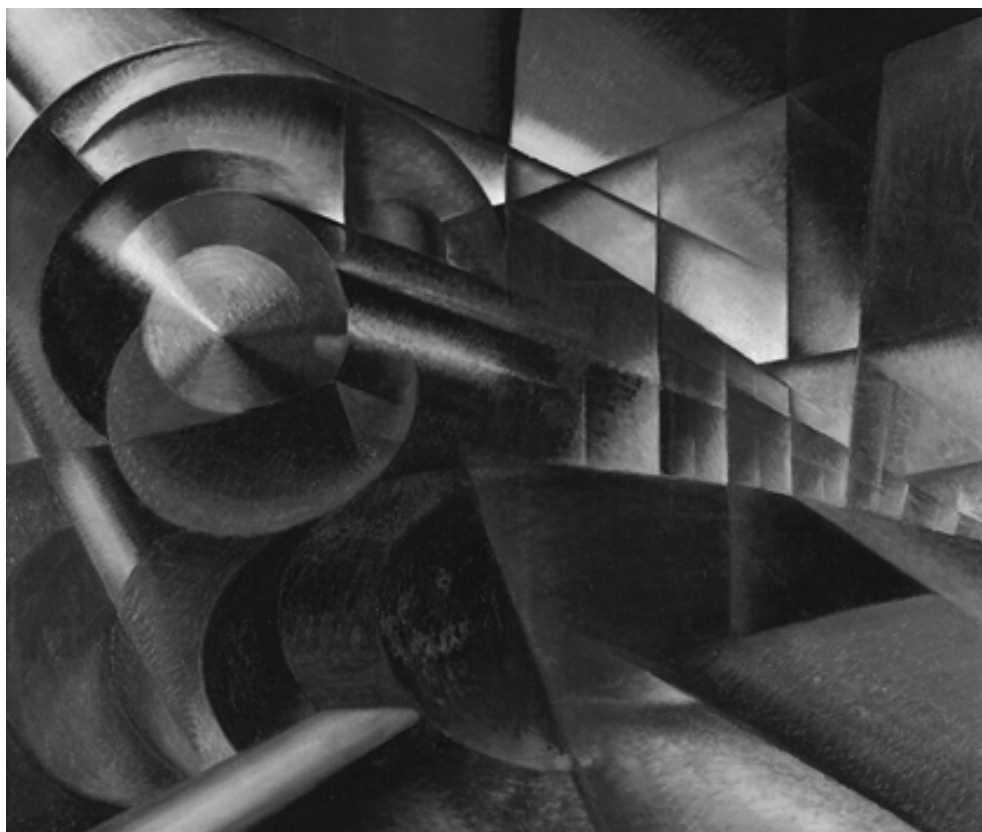
Иво Паннаджи. Ускоряющийся поезд, 1922 г.