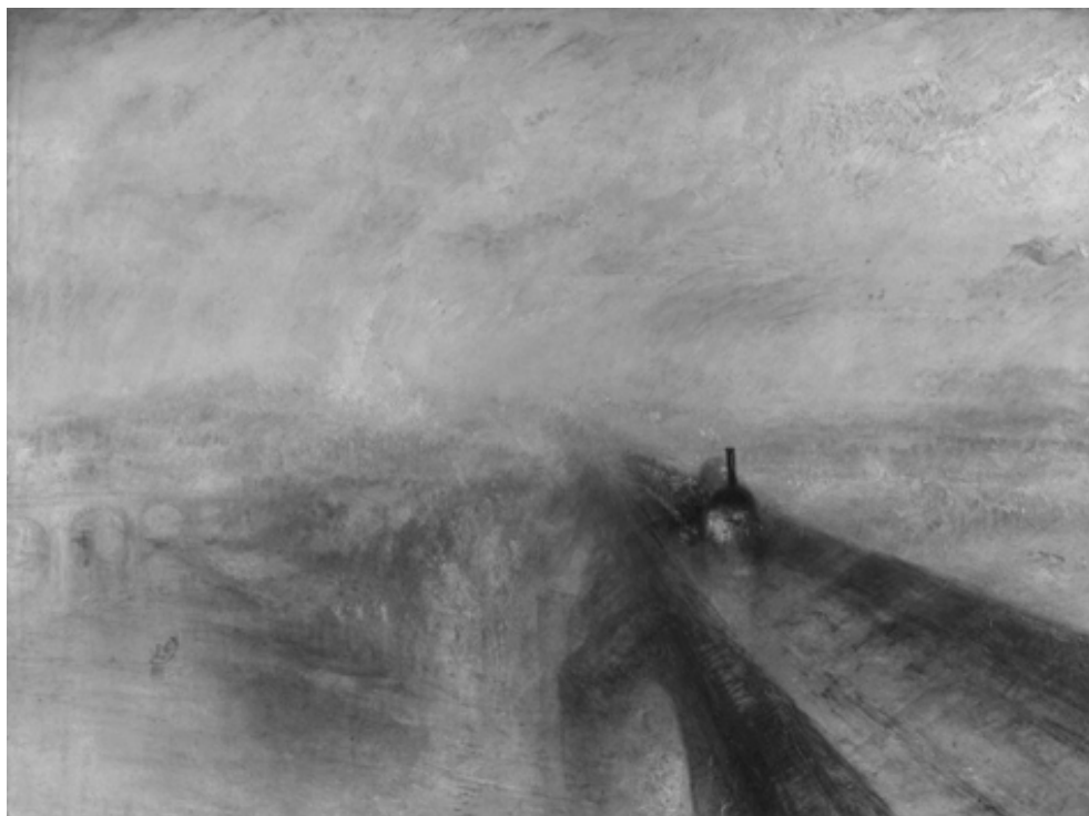
Уильям Тёрнер. Дождь, пар и скорость, 1844 г.